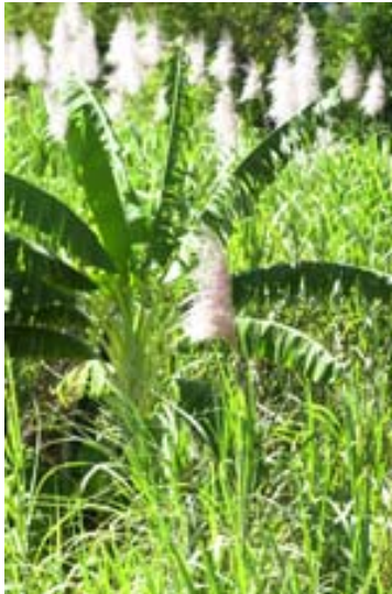
Ein kleiner im Zuckerrohrfeld,...