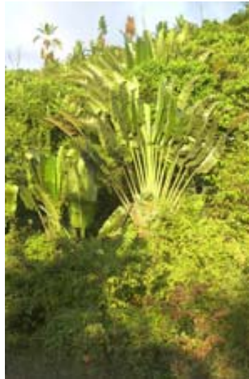
...ein Ausgewachsener in der Abendsonne ,...