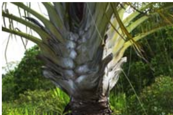
...der dreieckige Stamme des Ravenala madagascariensis bei Fort-Dauphin...