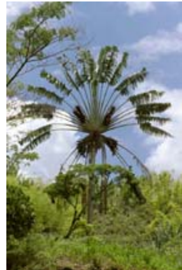
Ravenala, das Wahrzeichen |

Sein lateinischer Name: Ravenala madagascariensis . Er ist eine endemische und relativ schnell wachsende Baumart, welche sich vor allem dort ausbreitet, wo die Primärwälder abgeholzt oder abgebrannt wurden. Sein Stamm kann eine Höhe von 15 Metern erreichen. Die Blütezeit beginnt im September.