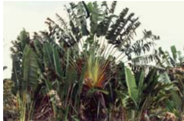
...und Gruppe von Ravenale