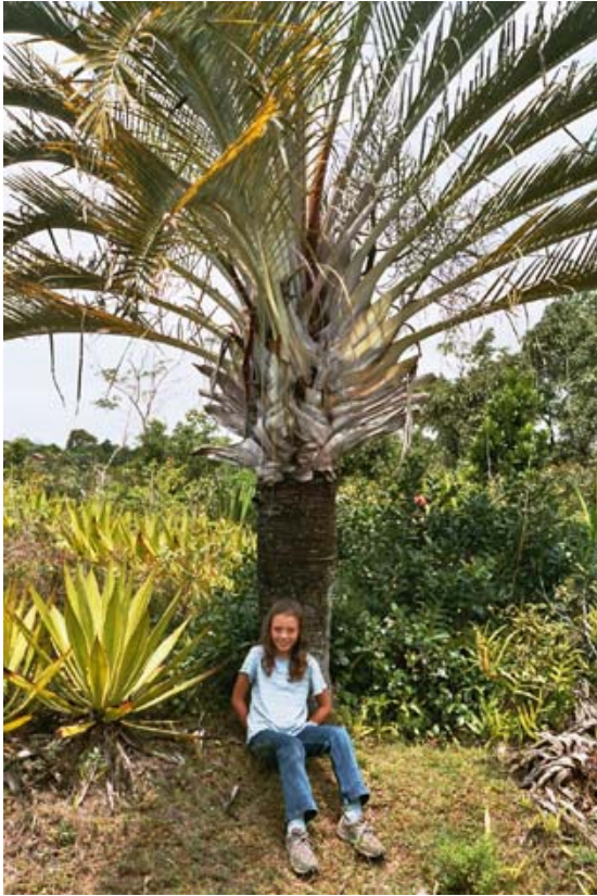
Dreieckiger Ravenala im Park von Nahampoana

▶ Siehe auch unter „ Eckdaten des Landes “, unter „ Geographie “ – Hochland , Norden , Osten , Süden , Westen , unter „ Glossar “ – Ravenala, unter „ Kunst und Kultur “ – Tavy, unter „ Masoala-Halle “, unter „ Naturschutzpärke “ – Privatpärke , unter „ Ortschaften “ – Tolanaro , unter „ Pflanzen “ – Bäume , Regenwald , unter „ Städte “ – Tamatave (Stand mit Artikeln aus Ravenale - Blättern),