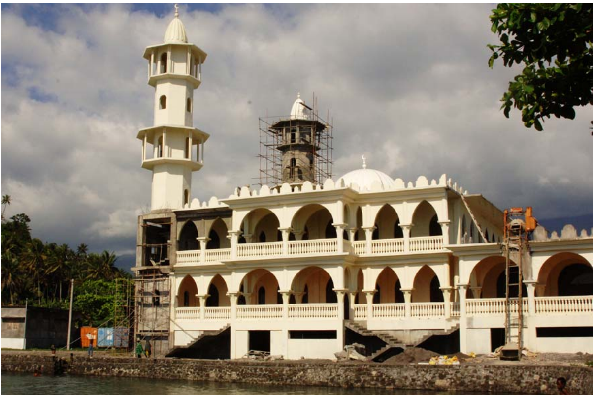
Grosse Moschee , welche 2006 noch im Bau war