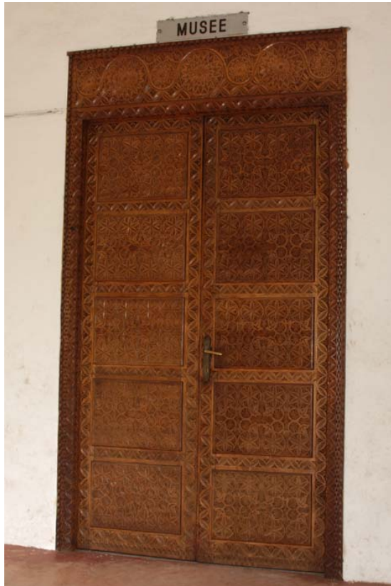
Eingangstüre mit Holzschnitzereien

Schmetterlinge Schmuckstücke Tücher Vögel