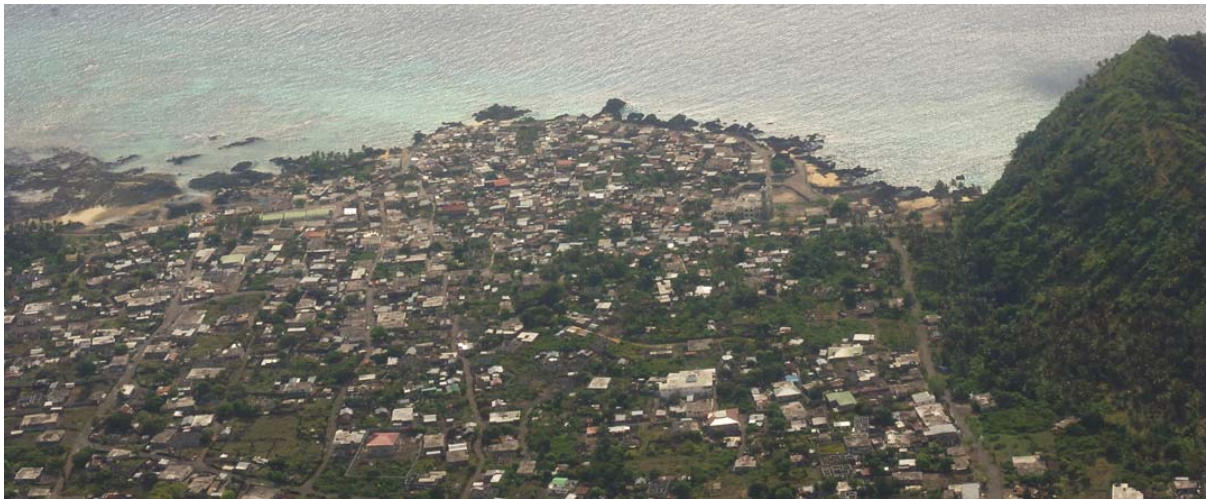
Luftaufnahme von Ikoni

Die Ruinen und das Grab des ehemaligen Prinz Ibrahim von Ikoni sind noch vorhanden und können besichtigt werden. Eine kleiner Rundgang durch die alten Gemäuer der Stadt mit seinen kleinen Gassen und Seitengässchen, den verschiedenen Moscheen, den Versammlungsplätzen „ Bangwe “ genannt, bis zur Gemeindeschule und dem Fischerhafen und anschliessend der dem Meer entlang führenden Hauptstrasse zurück zum Ausgangspunkt lohnt sich alle mal. Zwischen der Ruine des Prinzen und der neuen grossen Moschee, welche 2006 sich im Bau befand, liegt ein kleiner See, welcher allerdings nur bei Flut Wasser aufweisen, welches unterirdisch zu und wegfließt, dient als natürliches Schwimmbecken für die Kinder des Städtchens.