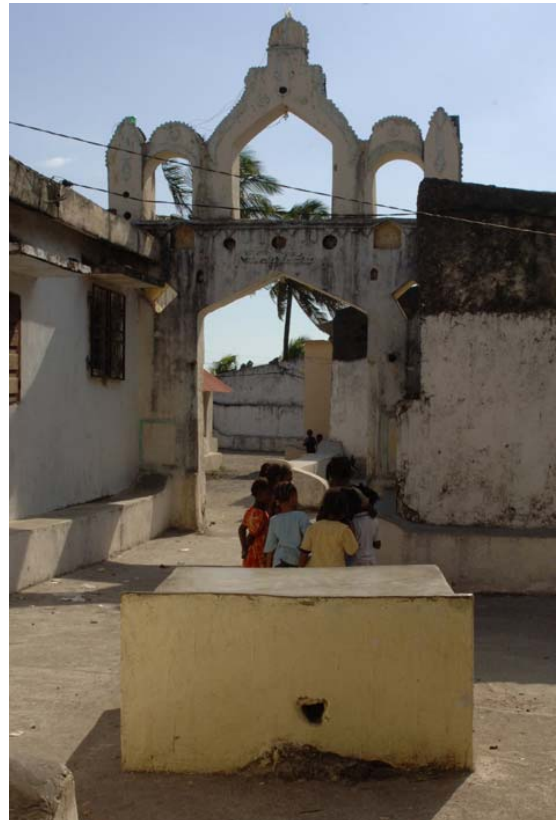
...führen (hier das Fussvolk) mit dem eingemauerten Gründungssteine der Stadt