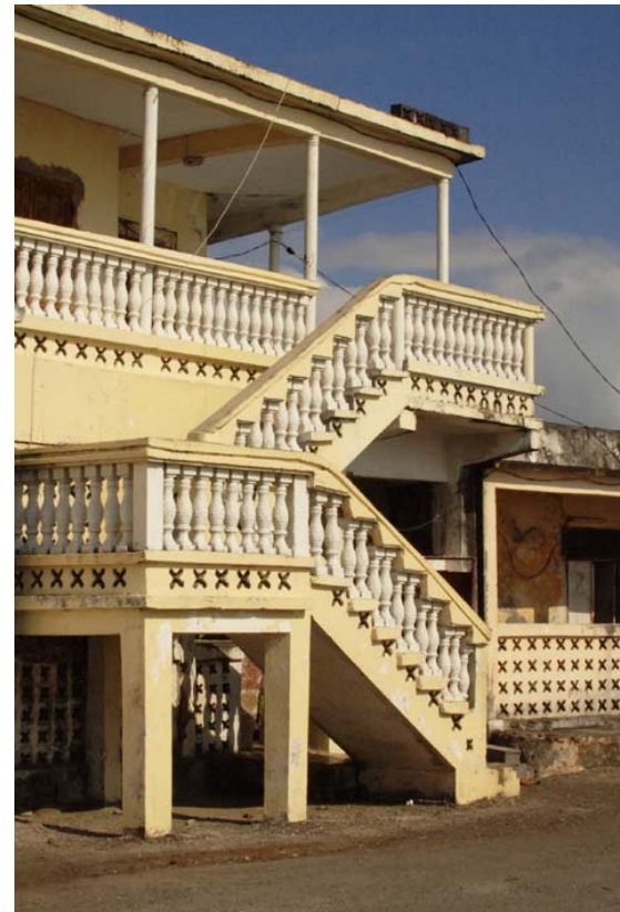
Haus an der Strasse am Meer