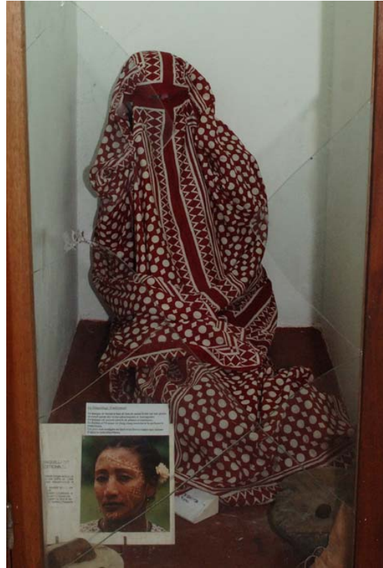
Traditionelles Kleid der Komorerin