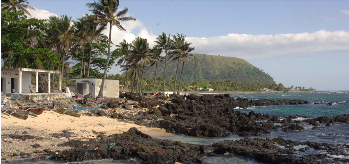
Bucht beim Fischerhafen mit Blick zum Hügel bei Bucht von Mbachile