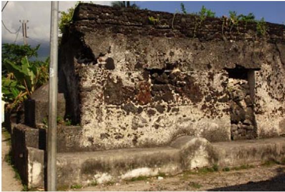
Alte Gemäuer, welche förmlich...