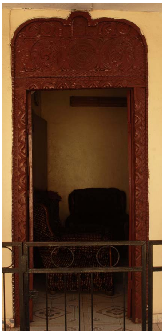
...Türen aus geschnitztem Holz