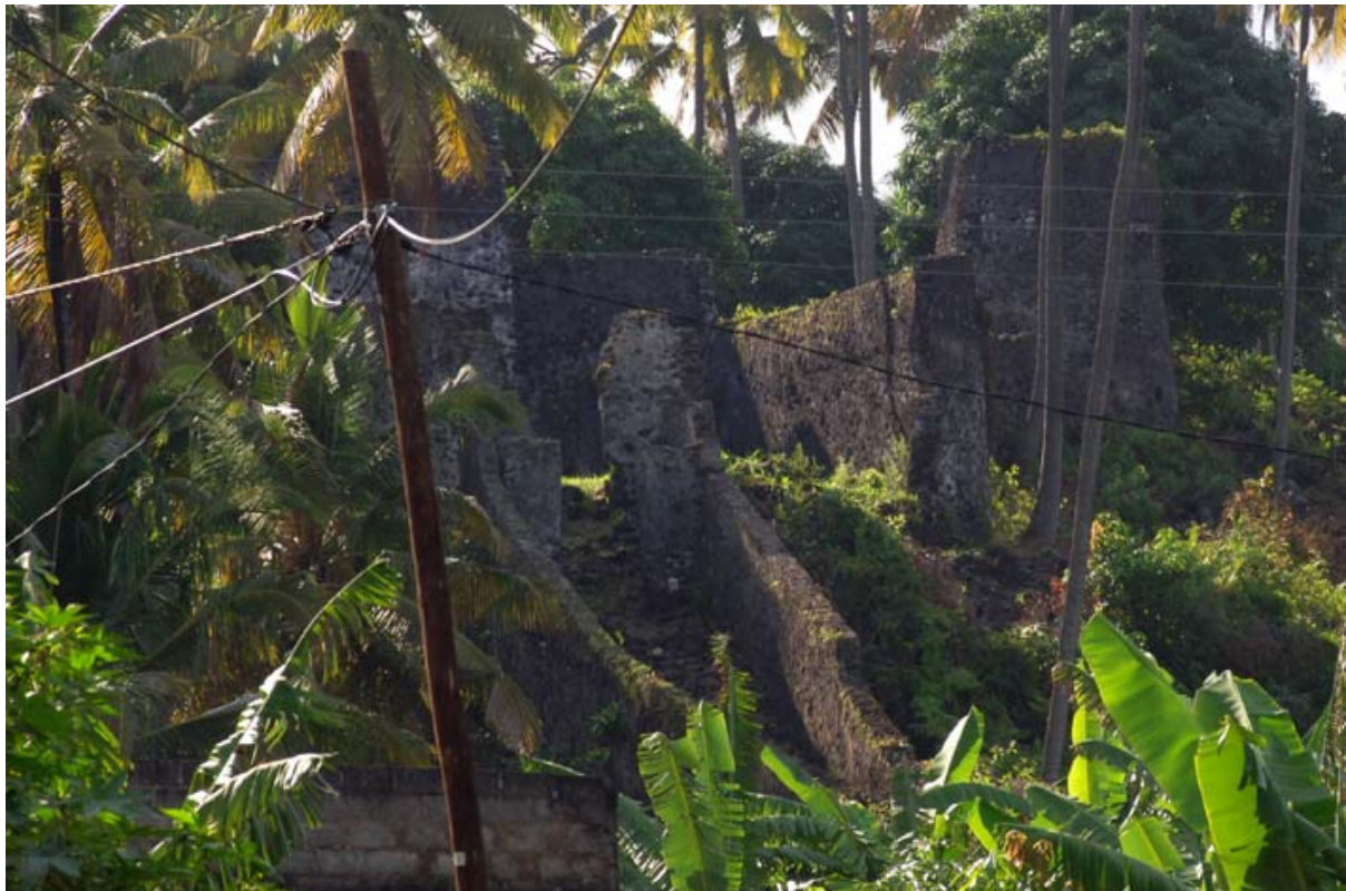
...Ruine des alten Sultan-Palastes