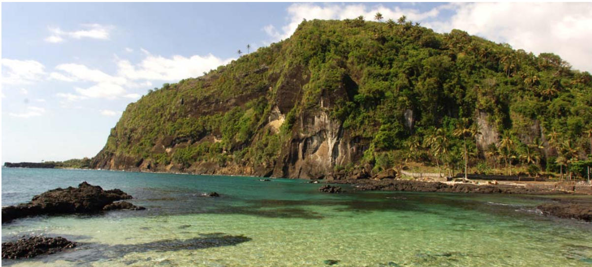
Felsen an welchem Frauen und Kinder den Freitod wählten