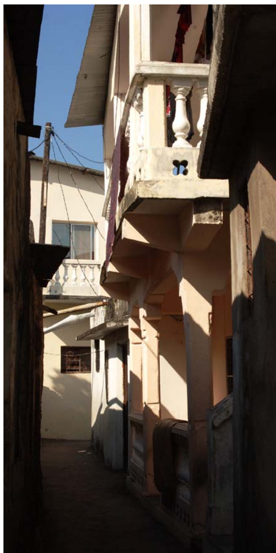
Enge Gassen mit...