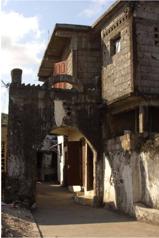
Alte Torbögen ,...