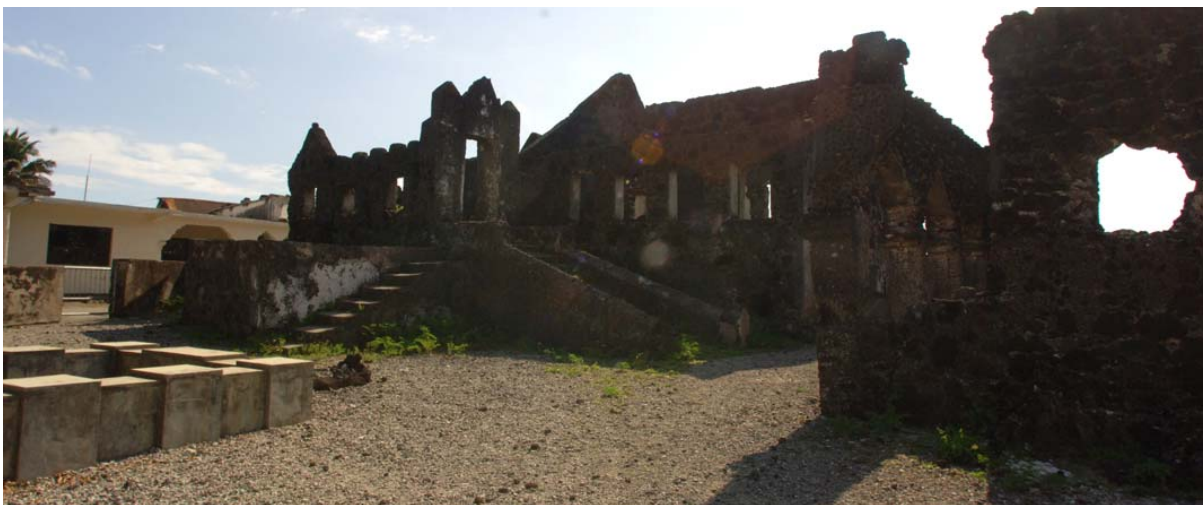
Ruine der Residenz und Grab des Prinz Ibrahim von Ikonj