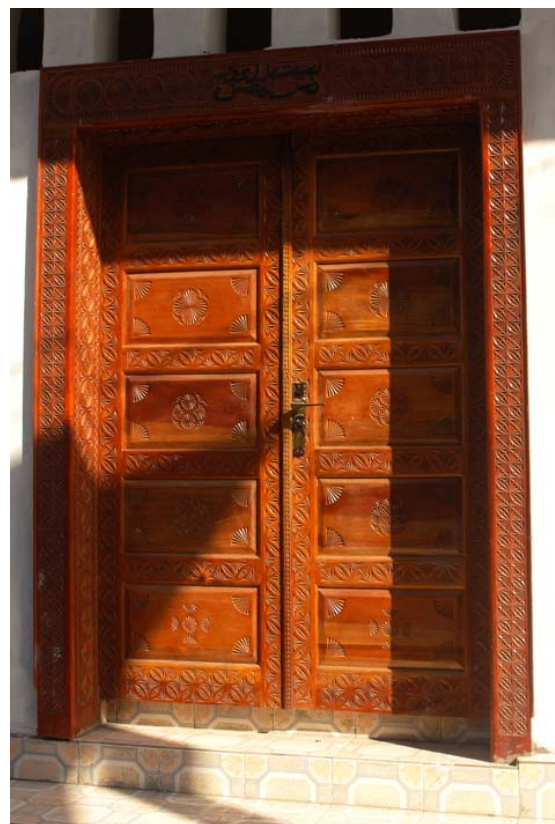
...Haustüren aus verziertem Holz