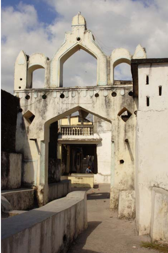
Bögen, die zu den Bangwe (hier die Noblen)...