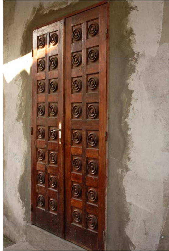
... Türen ,...