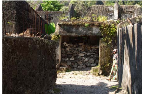
...nach der Geschichte riechen