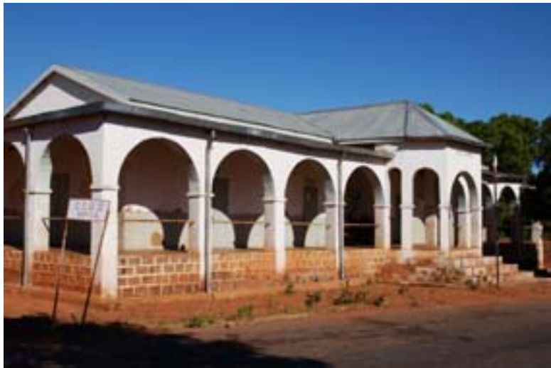
Spital in Andriba an der RN 4