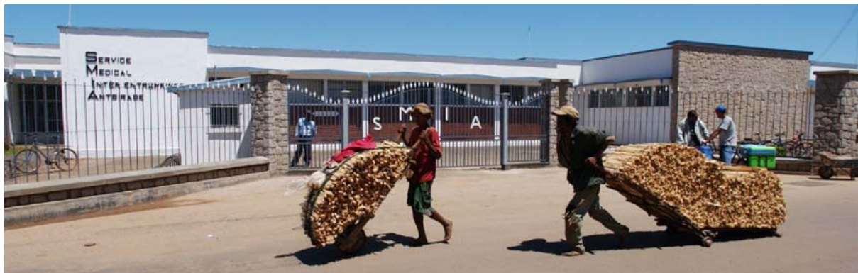
Medizinisches Zentrum der Arbeitgeber in Antsirabe