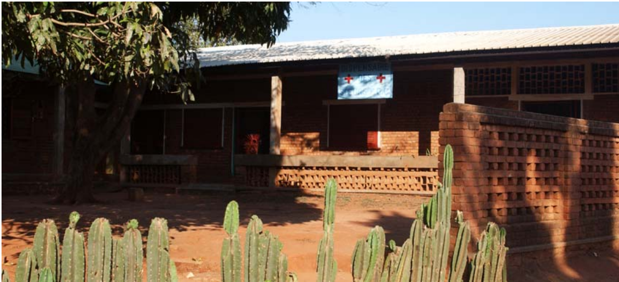
Poliklinik der katholischen Schwestern in Ihosy