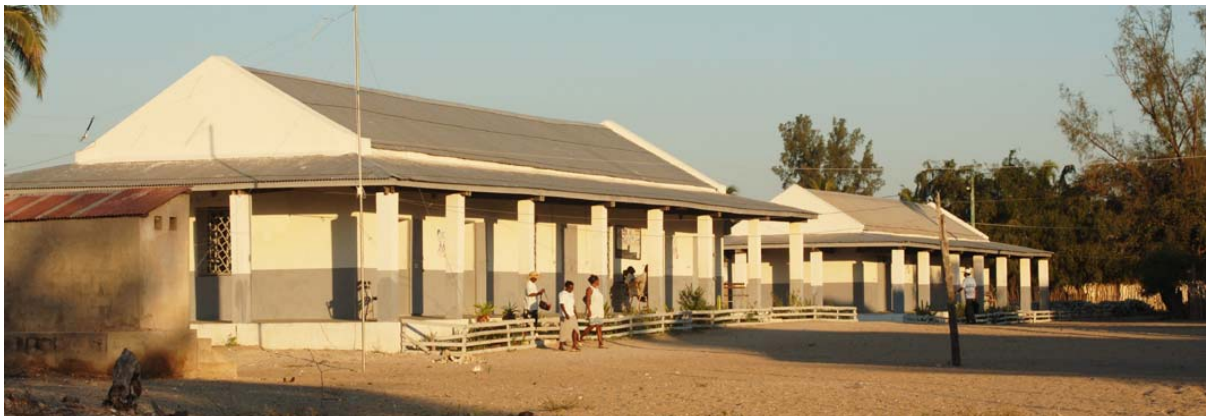
Das Hospital umfasst mehrere – teilweise abbruchreife – Gebäude

Was ist neu? Inhaltsverzeichnis Stichwortverzeichnis