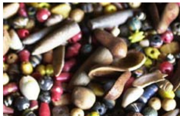
Naturheilmittel – Fanafody Gasy