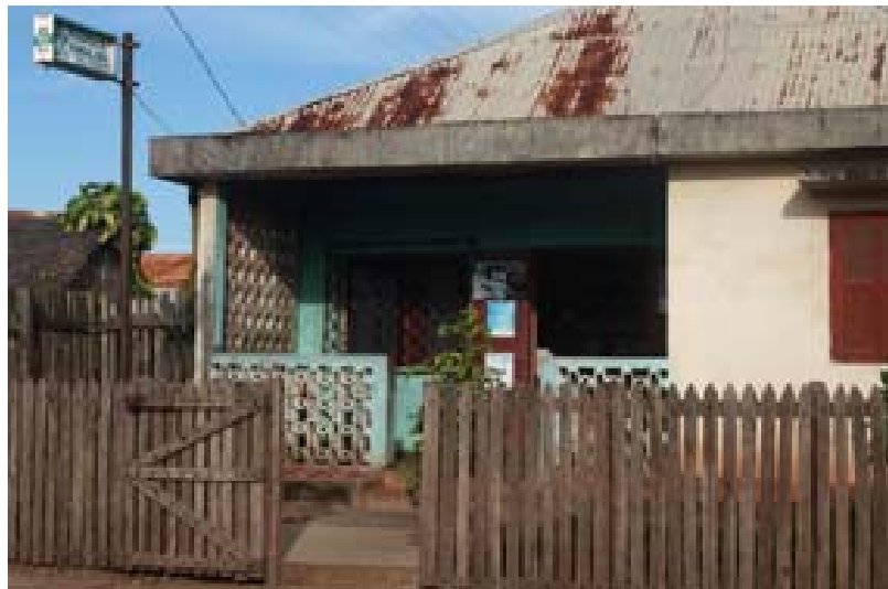
Apothek von Mananjary Reiseprospekt Newsletter Kontakt aufnehmen