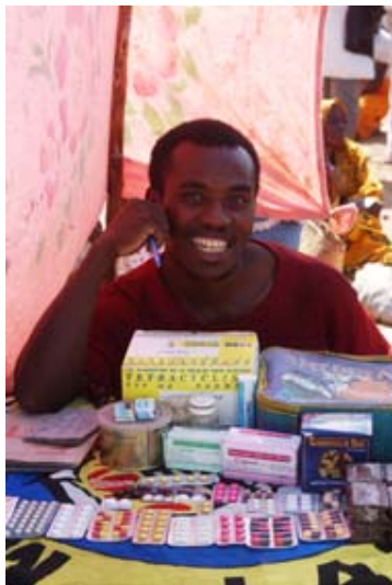
Fliegender Medikamenten-Händler auf dem Markt von Faux Cap Was ist neu? Inhaltsverzeichnis Stichwortverzeichnis