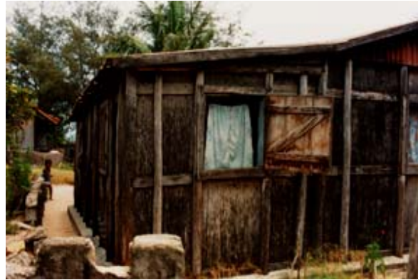
Arztpraxis in Fort-Dauphin