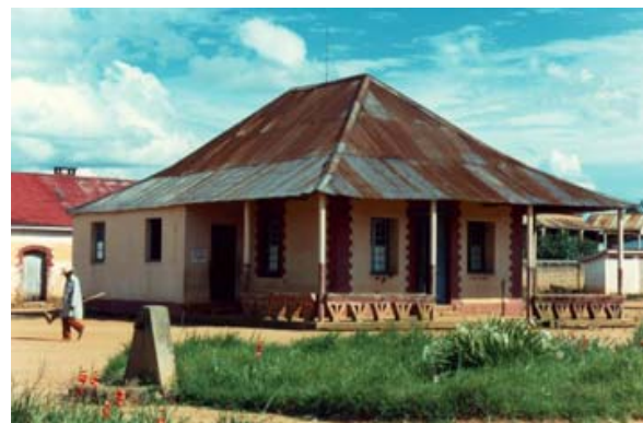
Chinesisches Spital von Mahitsy