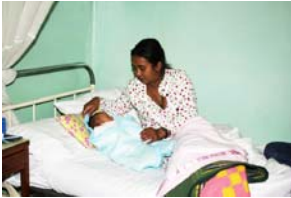
Mutter und Kind in einer Geburtsklinik