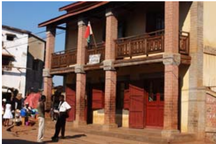
Cnaps -Gebäude in Ihosy , (Sozialversicherung des Landes)