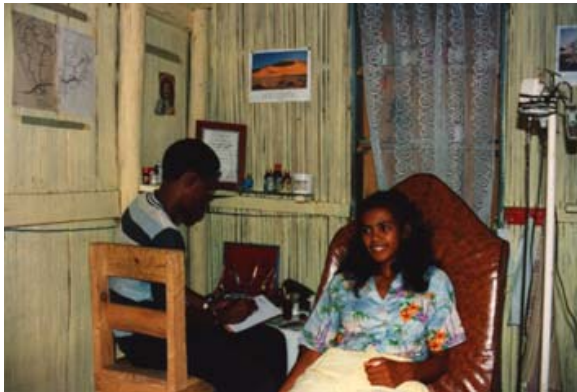
Zahnarztpraxis in Fort-Dauphin

Viele Madagassen vertrauen eher den Medizinern, Schamanen und Naturheilern als den klassischen Medizinern. Auf vielen Märkten werden diese Naturheilmittel in Form von Wurzeln, Rinden, Hölzern, Blättern, Blüten, Früchten, Kernen usw. angeboten.