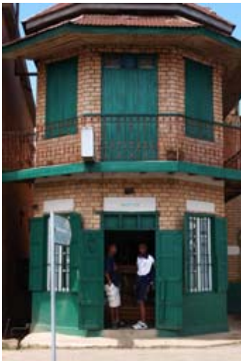
Apothek in Ambatolampy